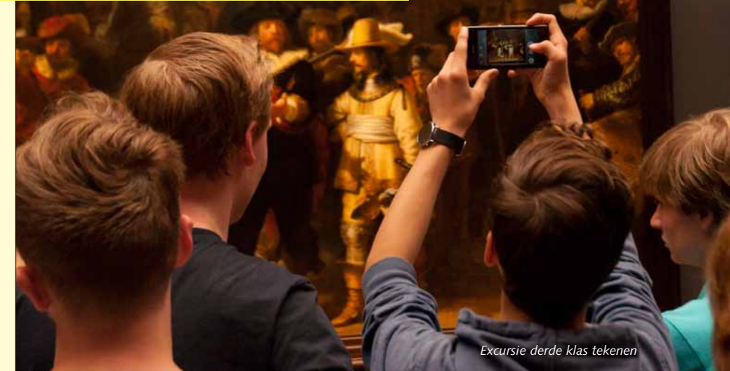
Excursie derde klas tekenen

Als vast onderdeel van het programma gaan de leerlingen van de vierde klas op reis. Dit schooljaar wordt er een keuzeprogramma aangeboden: een reis naar Frankrijk, een reis naar Duitsland en een reis naar Groot-