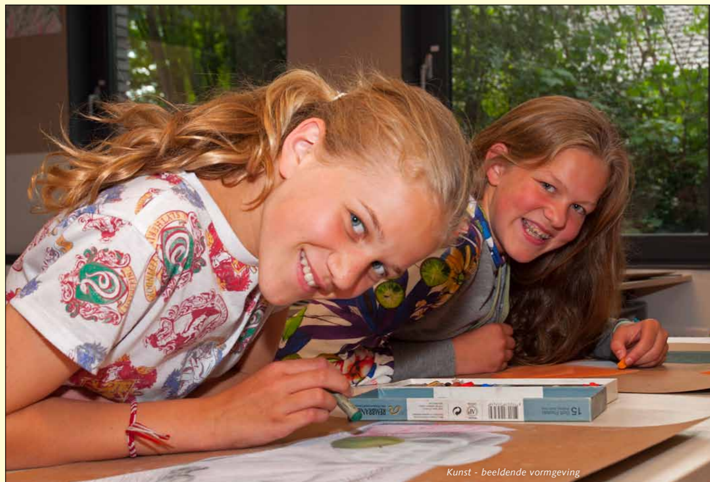
Kunst - beeldende vormgeving

Leerlingen van klas 1 en 2 kunnen gedurende een afgebakende periode op initiatief van de mentor of vakdocent verplicht worden op