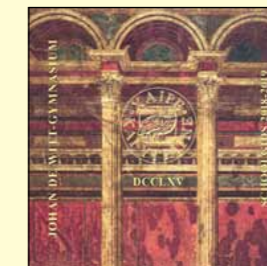
Cover: Villa dei misteri Pompei